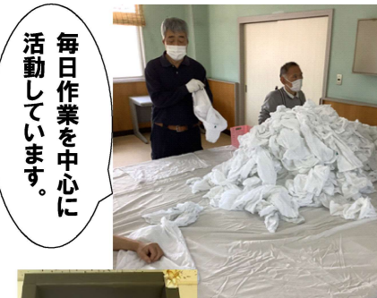
毎日作業を中心に活動しています。

「明るく・楽しい園」を目指し、障がいを持っていても、社会参加として「働くこと」を中心に支援を考えています。一人ひとりの個性を尊重して、ゆったりと働く事を支えていきます。