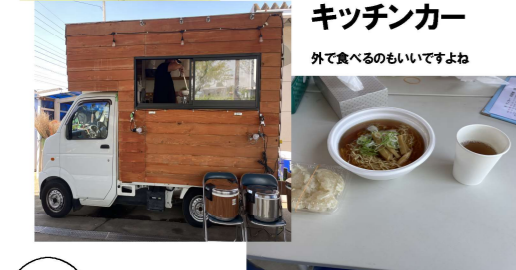
キッチンカー 外で食べるのもいいですよ