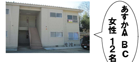
あすかABC 女性 12名

...グループホームとは... 障がいを持った人たちが自立を目指し地域において必要なサービスを受けながら共同して日常生活を送るところです。住宅地内の一般住宅やアパートで、地域住民の皆さんと関わりながら生活しています。