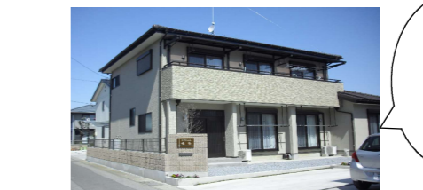
そら 男性 4名

てんしゃば 共同生活援助 グループホーム 館林市北成島町513-88 0276-49-5404