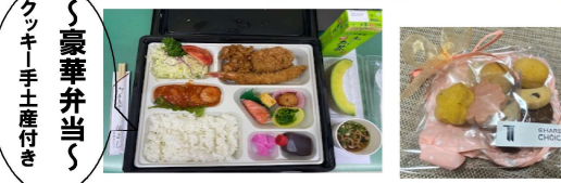
豪華弁当とクッキー手土産付き

ふらっぐ 障害福祉サービス事業所 就労継続支援事業B型 20名 館林市松原2丁目22-16 0276(76)7899