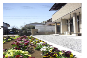
庭の手入れもみんなです。

...グループホームとは... 障がいを持った人たちが自立を目指し地域において必要なサービスを受けながら共同して日常生活を送るところです。住宅地内の一般住宅やアパートで、地域住民の皆さんと関わりながら生活しています。