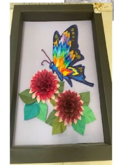
アゼリアモールの作品づくり