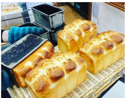
人気商品の食パン！菓子パン・調理パンも種類豊富！！

障がいがあっても住み慣れた地域で「自分らしく働き、自分らしく生きること」に理念を置き、作業支援を中心に障害特性に応じた工夫や配慮を第一に考えた支援を心がけています。